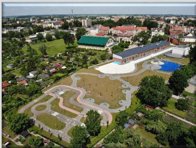
Zagospodarowany teren to dziś zieleń, miasteczko ruchu, siłownia. Długi budynek po lewej stronie to siedziba Zakładu Aktywizacji Zawodowej, po prawej widoczny „Parasol”.

dwóch partnerów – Rzymskokatolicką Parafię pw. Matki Bożej Wspomożenia Wiernych (odbudowa kaplicy) oraz Spółdzielnię Mieszkaniową „Przyszłość” (zagospodarowanie przestrzeni między blokami).