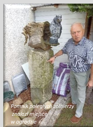
Pomnik poległych żołnierzy znalazł miejsce w ogrodzie