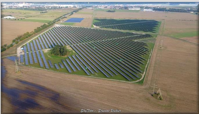
Hektary farm fotowoltaicznych w pobliżu Krapkowic

- Na szczęście nawałnice ominęły powiat krapkowicki. Odnotaliśmy jedno zawalenie budynku w Straduni, ale obiekt i tak miał zostać wyburzony. Został więc – jak się okazało – rozebrany siłami natury.