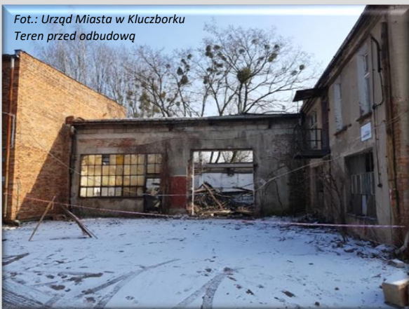
Teren przed odbudową

To odwołanie do dawnych zdjęć jest zasadne, bo dziś po ruinach ani śladu. Jest za to pięknie urządzonego teren z mnóstwem zieleni, siłowniami zewnętrznymi, miasteczkiem ruchu drogowego, a w tym otoczeniu dwa wspaniale zrekonstruowane budynki – pierwszy ze świetlicą środowiskową „Parasol” i kolejny mieszczący Zakład Aktywizacji Zawodowej oraz kawiarnię kinową, jako że w sąsiedztwie mieści się kino „Bajka”. Inwestycja pod oficjalną nazwą „Rewitalizacja Kluczborka poprzez podniesienie jakości przestrzeni publicznej oraz zapobieganie i przeciwdziałanie wykluczeniu społecznemu” zrealizowana została z Regionalnego Programu Operacyjnego Województwa Opolskiego na lata 2004-2020 (Działanie 10.2 Inwestycje wynikające z Lokalnych Planów Rewitalizacji). Jej całkowita wartość to ponad 12 mln złotych. Na tę kwotę złożyło się 4,6 mln dofinansowanie z RPO oraz kwota 6,8 mln zł z budżetu kluczborskiego samorządu.