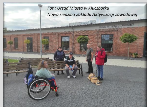
Nowa siedziba Zakładu Aktywizacji Zawodowej

Ponieważ obiekt ma około tysiąca metrów kwadratowych powierzchni w jego części ulokowała się kawiarnia kinowa, nawiązująca wystrojem i atmosferą do pobliskiego kina