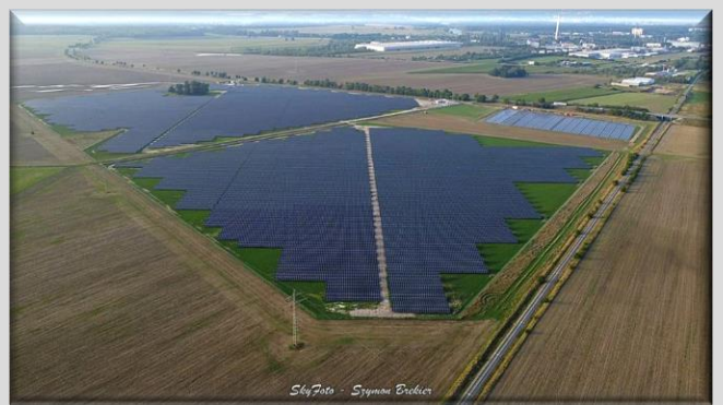
Hektary farm fotowoltaicznych w pobliżu Krapkowic

- Co charakteryzuje budownictwo powiatu krapkowickiego?