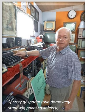
Sprzęty gospodarstwa domowego stanowią pokazną kolekcję

Kto by pomyślał, że niewielka posesja przy ulicy księdza Londzina w opolskiej Nowej Wsi Królewskiej kryje takie skarby. W ogródku – fragment pomnika upamiętniający żołnierzy poległych w czasie I wojny światowej, w trawie historyczne płyty chodnikowe z napisami nieistniejących już wytwórni, duże sprzęty gospodarstwa domowego